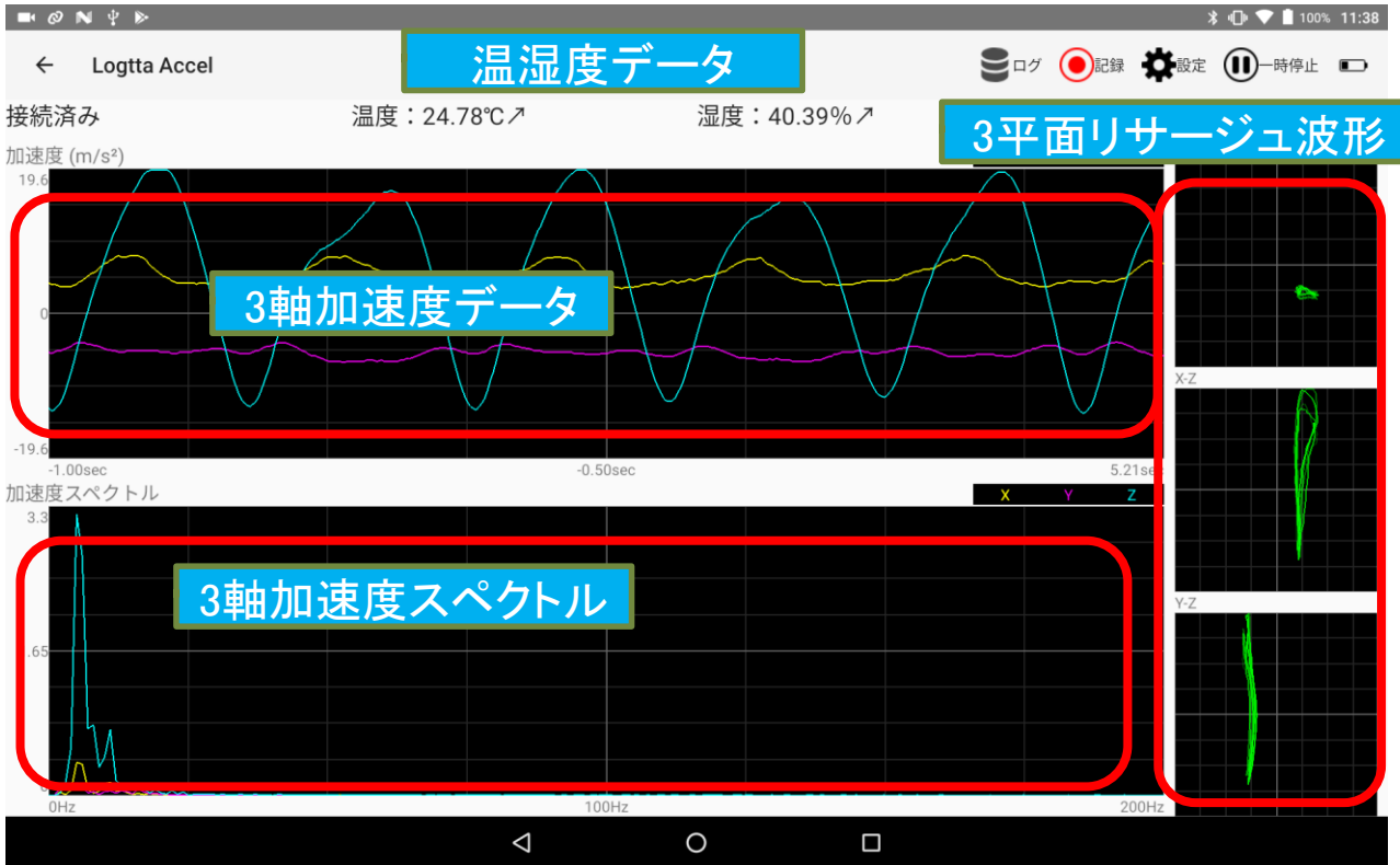
リアルタイムログ

3軸の加速度、スペクトル、リサージュ波形、温湿度をリアルタイムで表示（アンドロイド端末画面） サマリーログで加速度ピーク・RMSと、温湿度を記録